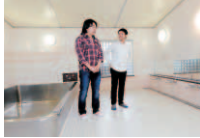
3 銭湯感覚の風呂には0時まで入れます。はだかの付き合ひもまた楽し。